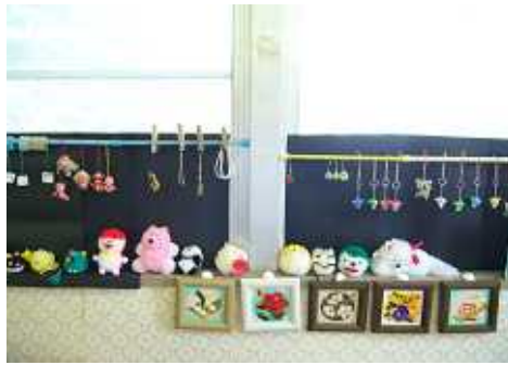
( 手工芸 )