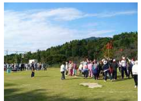
( 運動会 )