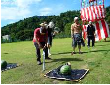
( 夏祭り )

当院のOTでは自然に囲まれたおだやかな環境の中で、患者様が意欲的に治療に参加できるよう各種プログラムを取り入れております。また年間行事として花見やバスハイク、夏祭り、運動会、年忘れ演芸会等を行っています。